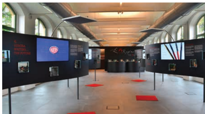
Una sala del museo Officina della Scrittura di Aurora Penne

Il museo ha l’obiettivo di tutelare il patrimonio italiano rappresentato da un intero settore del Made in Italy e, allo stesso tempo, valorizzare il territorio dove tutto è nato. Si sviluppa su una superficie di 2mila metri quadri racchiusa in un edificio color “rosso Cimbali” con annesso uno spazio polifunzionale di circa 300 metri quadri (Hangar 100), che ospita eventi e mostre temporanee. All’interno del museo sono esposte 100 macchine provenienti dalla Collezione Cimbali e Collezione Maltoni. L’area muse-