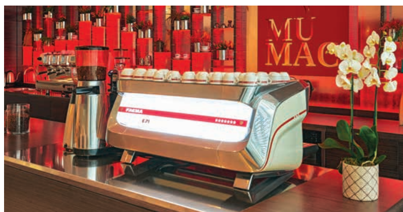
Una delle macchine da caffè esposte al MUMAC

All'interno di MUMAC si è da poco concluso Technology heart human mind , un evento espositivo promosso da Gruppo Cimbali per celebrare il brand e per svelare il volto umano che si cela dietro alla tecnologia. La mostra si sviluppa tra reale e virtuale attraverso quattro blocchi narrativi ( heritage , design e innovazione , tecnologia e sensi ), che culminano in una stanza caleidoscopica, cuore pulsante dell'intero racconto. Nella sala im-