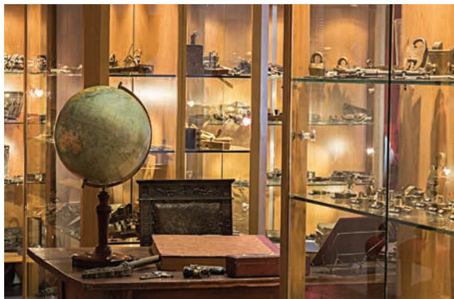
Una parte del Museo della Chiave Bianchi 1770