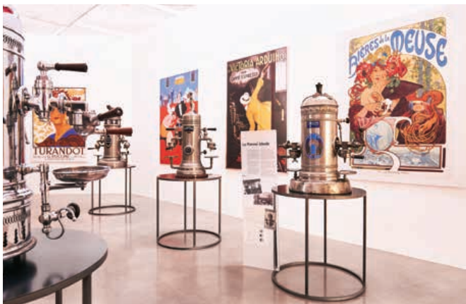
Una sala del MUMAC che racconta l'evoluzione della società attraverso i cambiamenti della macchina da caffè

ale propone un percorso in sei periodi storici, sei sale con scansioni cronologiche del Novecento, secolo durante il quale la macchina da caffè è profondamente cambiata, accompagnando la cultura e il costume della nostra società. L'ultima sala presenta una pianta ad anello con un volume rosso centrale, all'interno del quale è ospitata un'installazione di grande forza espressiva, l'esplosione della macchina modello M100.