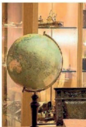
Il museo della chiave